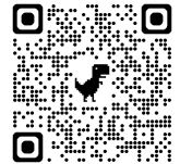
小児科一般診療QRコード