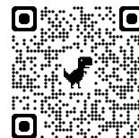
小児科一般診察QRコード