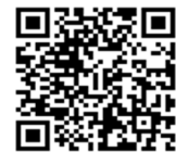
大学病院ホームページ