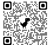
小児科一般診療QRコード

＜リハビリテーション室＞ 月曜日～金曜日 9:00～11:30 / 13:00～16:30 ※完全予約制